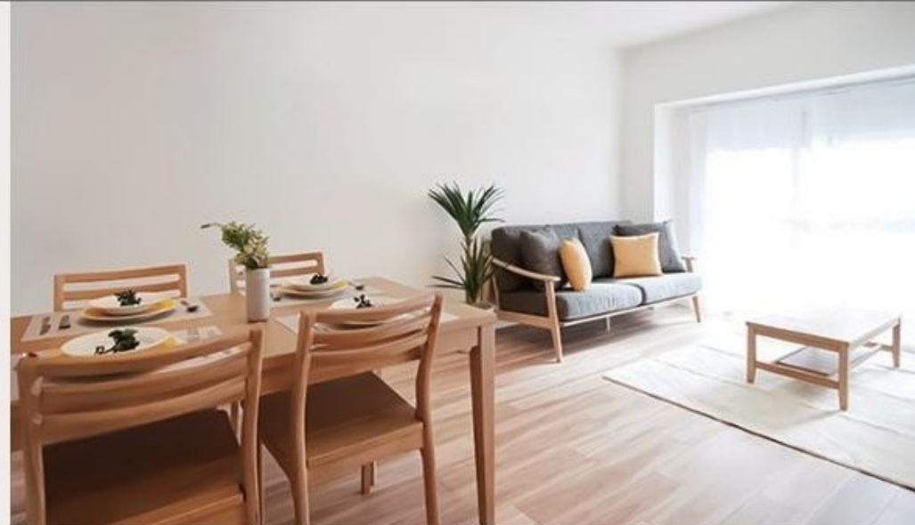
【イメージ写真】写真は一例ですので実際のものとは異なる場合があります。